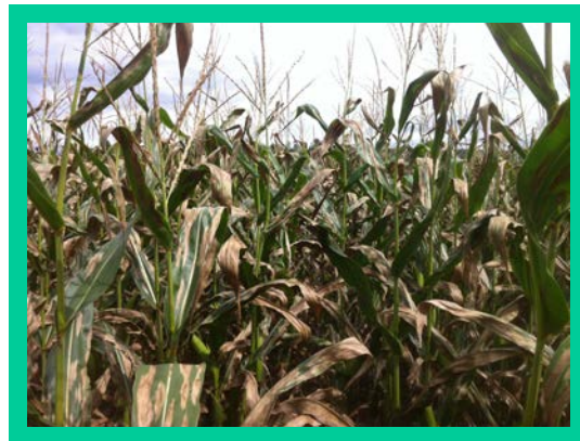
चित्र. संक्रमित मकैको बिरुवा

नोट : प्रकाशकको अनुमति बिना यस प्रकाशनको बिक्री वितरण वा कुनै पनि व्यापारिक प्रयोजनका लागि प्रयोग गर्न पाइने छैन । यस सामग्रीमा दिइएको जानकारी विभिन्न विज्ञको सल्लाह तथा अन्य संघसंस्थाले प्रकाशन गरेका सामग्रीमा दिइएको जानकारीका आधारमा निर्माण गरिएका हुन् । यसमासमुदायले आफ्नो प्रयासमा गर्न सक्ने जानकारी दिइएको छ । तर विशेष परिस्थितिमा पुनः सम्बन्धित विज्ञको सल्लाह लिनु पर्नेछ ।