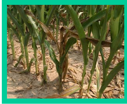
चित्र. संक्रमित मकैको बिरुवा