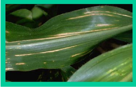
चित्र. संक्रमित मकैको पात