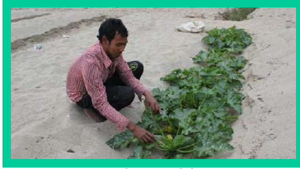
चित्र: बगर खेती

बगर खेती अन्तर्गत कुन कुन बाली कुन समयमा लगाउने ?