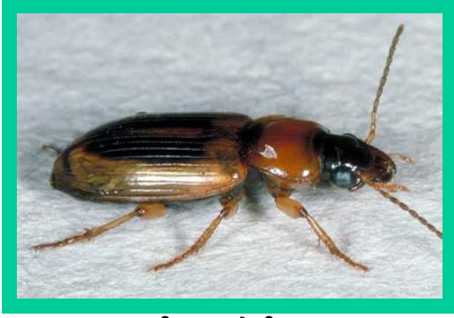
चित्र. खुम्रे किरा