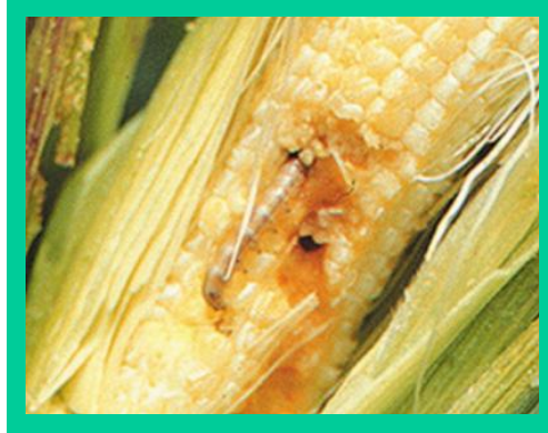
चित्र. गवारोले क्षति गरेको मकैको डाँठ