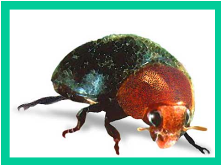
चित्र. फौजी किरा

फौजी किरा अचानक धेरै सङ्ख्यामा देखा पर्छन् ।