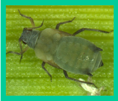
चित्र. लाही किरा