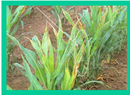
चित्र. लाही किराको क्षति