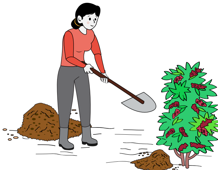
Tabla 3 Aplicación de abono al suelo de café en producción

Para el caso de plantaciones con producciones de 20 quintales/ha, se recomienda aplicar abono en la etapa de floración, en la etapa de llenado del grano y un mes antes de la etapa de maduración del fruto de café: