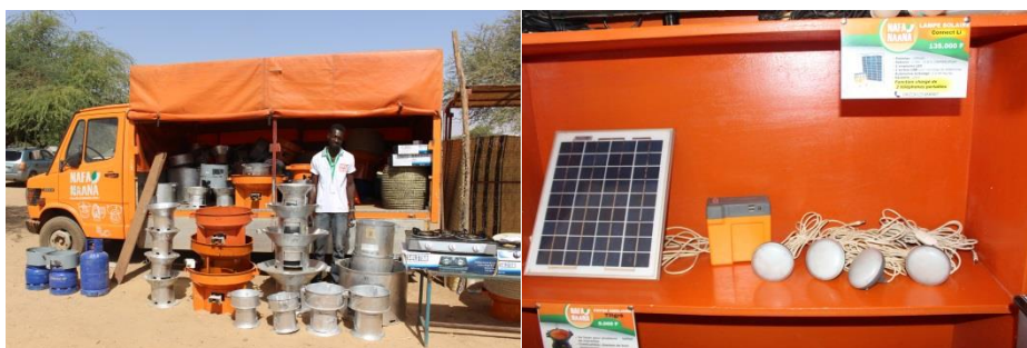
Equipements de cuisson et d'éclairage distribué par l'entreprise

Nous disposons de kits solaires dite « PLUG AND PLAY » ou prêt à l'emploi. Les kits solaires en générale sont de plusieurs qualités. Elles sont en générale dimensionnées aux besoins de l'utilisateur. Deux qualités de kits sont commercialisées. Les coûts varient entre 75.000 CFA et 135 000 CFA à l'achat. Les frais d'installation sont de 5000 CFA à Ouagadougou. En dehors de la capitale Ouagadougou, en plus des frais d'installation, les frais de transports des techniciens sont à la charge du client. Nos produits sont certifiés Lighting Global .